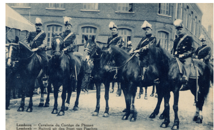
Lembeek — Cavalerie du Courbe de Pannes Lembeek — Retour uit den Stroot van Paschen

>>> lees verder op de volgende pagina >>>